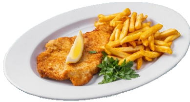
Schnitzel „Wiener Art“ mit Pommes Frites 10,50 €