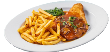
Pilzrahmschnitzel mit Pommes Frites 10,50 €