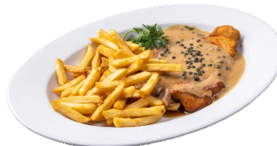
Pfefferrahmschnitzel mit Pommes Frites 10,50 €