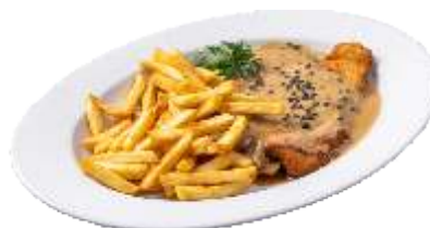
Pfefferrahmschnitzel mit Pommes Frites 8,50 €