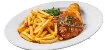
Pilzrahmschnitzel mit Pommes Frites 8,50 €