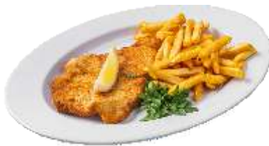
Schnitzel „Wiener Art“ mit Pommes Frites 8,50 €